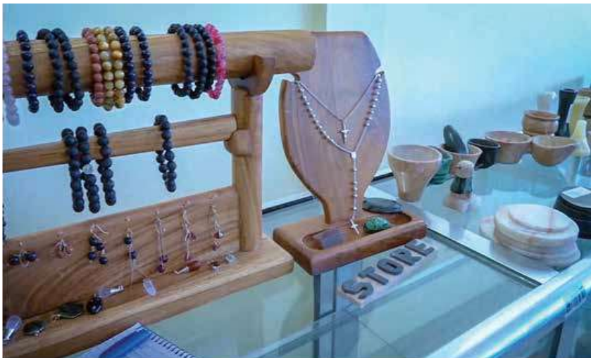
Picha Na. 10: Baadhi ya Bidhaa Zinazozalishwa na Kituo cha Jemolojia Tanzania -Arusha

123. Mheshimiwa Spika, Kituo cha Jemolojia Tanzania kinatoa mafunzo ya uongezaji thamani madini katika fani za utambuzi wa madini ya vito; uchongaji wa vinyago vya miamba na madini; ukataji na ung'arishaji wa madini ya vito na utengenezaji wa bidhaa za usonara. Aidha, TGC inatoa huduma za utambuzi wa madini ya vito kupitia maabara yake. Pia, TGC inatengeneza bidhaa zinazotokana madini ya vito na miamba. Katika kipindi cha Julai 2023 hadi Machi 2024 TGC imetekeleza majukumu yafuatayo: