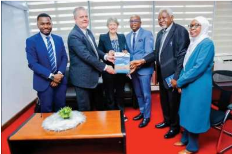
Picha Na. 11: Waziri wa Madini Mhe. Anthony P. Mavunde (Mb.), akikabidhiwa ripoti ya tathmini ya TEITI.

132. Mheshimiwa Spika , matokeo ya tathmini hiyo yanaonesha kuwa Tanzania imetekeleza vigezo vya EITI vya mwaka 2019 kwa kupata alama 77 kati ya 100. Bodi hiyo imepongeza juhudi za Serikali na wadau mbalimbali katika kufanikisha utekelezaji wa shughuli za uhamasishaji uwazi na uwajibikaji hapa nchini.