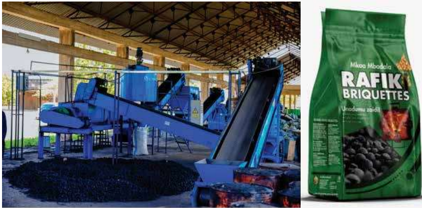
Picha Na. 8: Mtambo wa kuzalisha mkaa mbadala wa kupikia (Rafiki Briquettes)

104. Mheshimiwa Spika , STAMICO imeendelea na uzalishaji wa mkaa mbadala kutokana na makaa ya mawe unaotambulika kama Rafiki Briquettes. Aidha, STAMICO imeendelea na usimikaji wa mitambo miwili (2) yenye uwezo wa kuzalisha tani 20 kwa saa katika maeneo ya Kiwira na Kisarawe kwa ajili ya kuanza uzalishaji mkubwa. Vilevile, shirika linaendelea na jitihada za kuongeza uzalishaji katika mradi wa mkaa mbadala wa kupikia ambapo hadi kufikia Machi 2024 Shirika limenunua mitambo mingine miwili (2) ambayo tayari imewasili nchini yenye uwezo wa kuzalisha tani 20 kwa saa na kufanya idadi ya mitambo kuwa minne (4) hadi kufikia Machi, 2024.