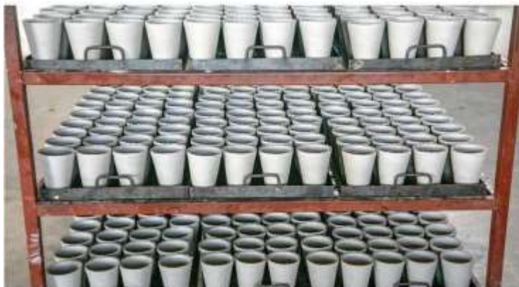
Picha Na. 9: Vikombe Vya Kuyeyushia Sampuli za Miamba ya Madini ya Dhahabu Vinavyotengezwa Katika Maabara ya GST

118. Mheshimiwa Spika, GST imeendelea kufanya uchunguzi wa sampuli za miamba na udongo kutoka kwa wateja kupitia maabara yake ya jiosayansi kwa kuzingatia viwango vinavyokubalika kimataifa. Kwa kipindi cha Julai 2023 hadi Machi 2024 jumla ya sampuli 10,307 za miamba na udongo zimefanyiwa uchunguzi kati ya sampuli 17,000 zilizokusudiwa katika mwaka mzima. Aidha, GST imezalisha vyungu vya uchunguzi wa maabara (Crucibles) 22,989 na Cupels 6,484 kwa ajili ya matumizi ya maabara yake.